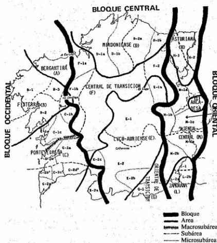
Figura 2. Bloques, áreas, subáreas e microsubáreas da lingua galega

Na seguinte imaxe poden apreciarse as áreas oriental-central á que pertencen as variedades de Viana do Bolo e da Gudiña e a área zamorana á que pertencen por unha banda, as variedades da Mezquita que xunto coa de Lubián forman a subárea A Mezquita-Lubián e por outra banda, a subárea de Porto.